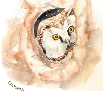
Chouette de Tengmalm