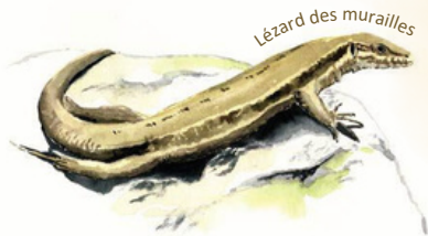
Lézard des murailles